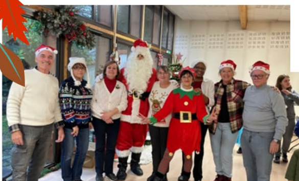
Père Noël des enfants le 8 décembre