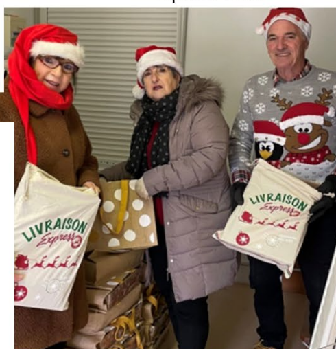
Distribution des colis aux Séniors le 14 décembre matin