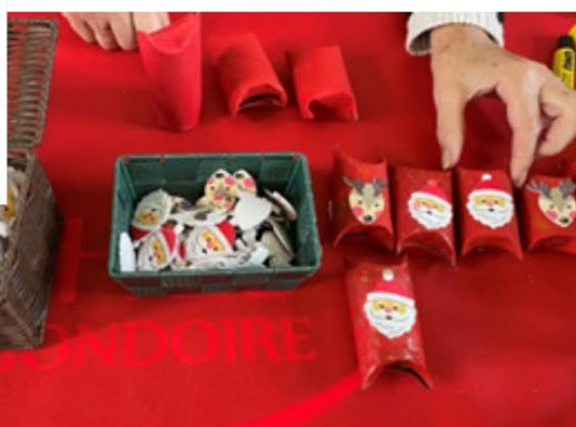
Atelier des lutins du 14 décembre après-midi